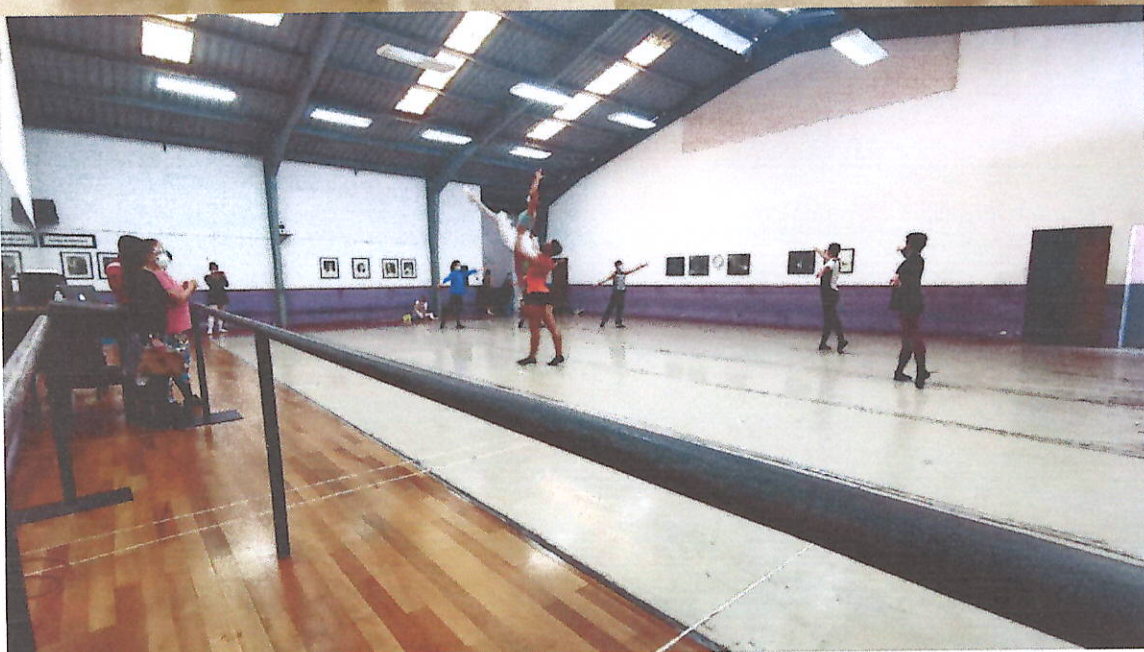
Semana del 07 al 11 de Junio 2021