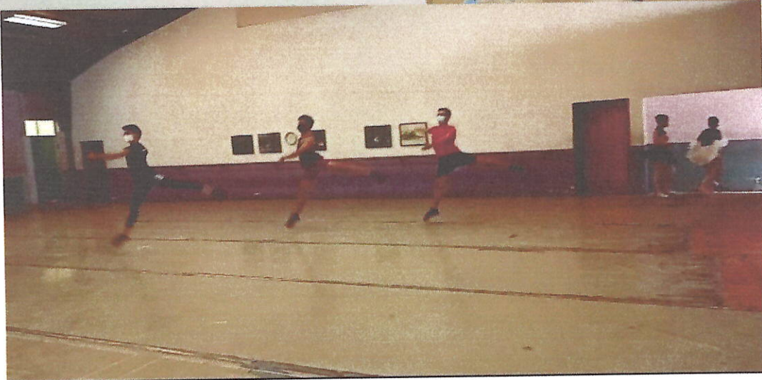
Semana del 01 al 04 de Junio del 2021