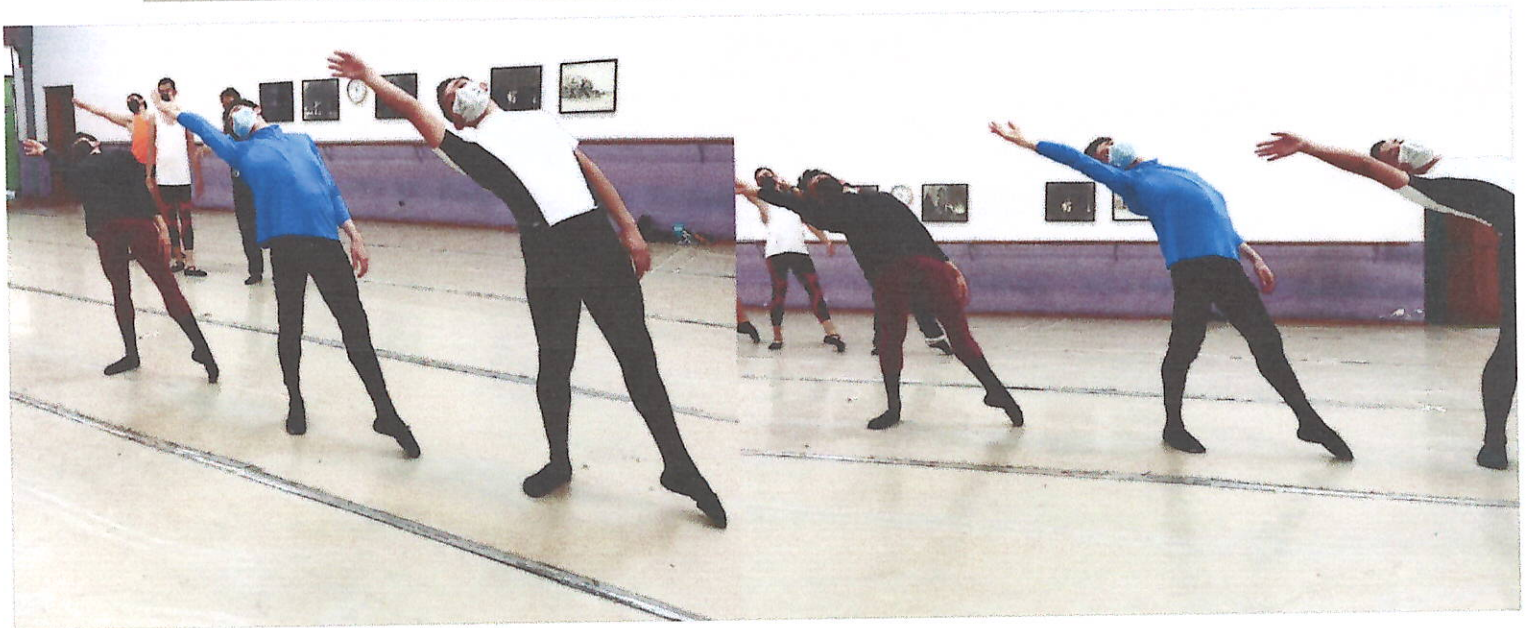
Semana del 14 al 18 de Junio 2021